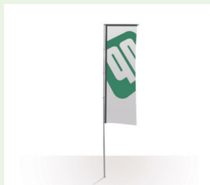
Fahnen für Ausleger