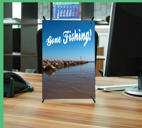
Mini X-Banner Tisch-Display 22 x 40 cm